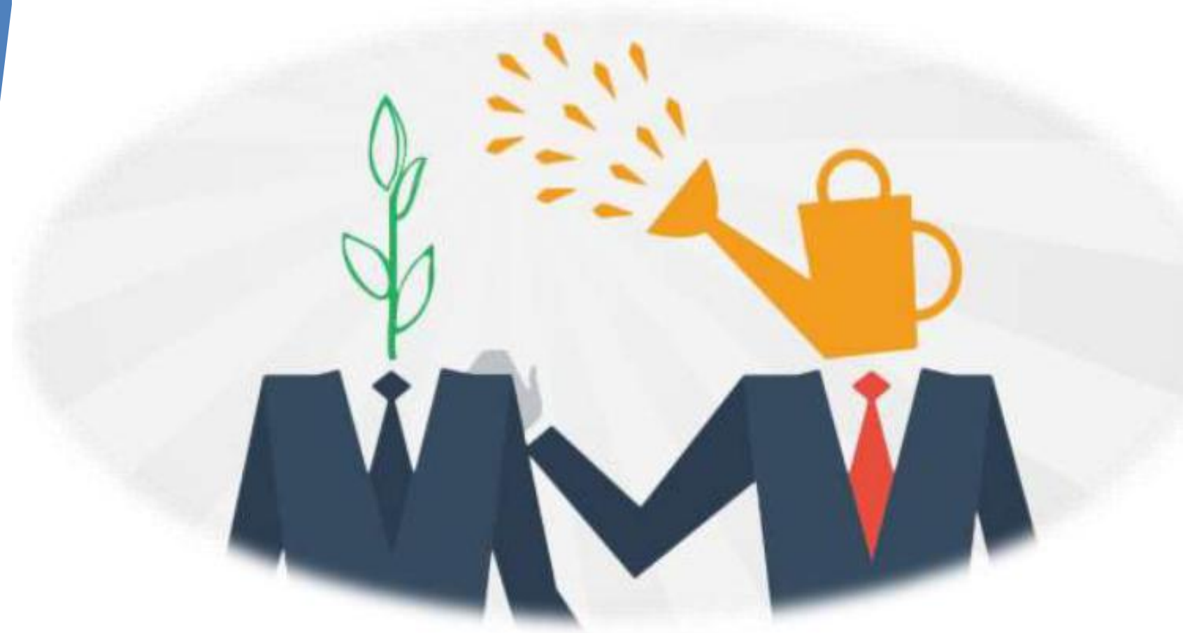
Рис.1 «Наставник и наставляемый» по принципу Боба Орби и Джосси Басса

Метод наставничества – способ непосредственного и опосредованного личного влияния одного человека на другого человека.