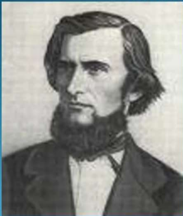
Константин Дмитриевич Ушинский (1824–1870)

«Ушинский - это наш действительно народный педагог, точно так же, как Ломоносов - наш первый народный ученый, Суворов - наш народный полководец, Пушкин - наш народный поэт, Глинка - наш народный композитор»