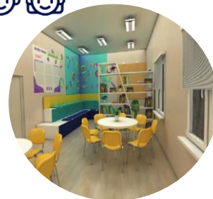
ЦЕНТРЫ ДЕТСКИХ ИНИЦИАТИВ