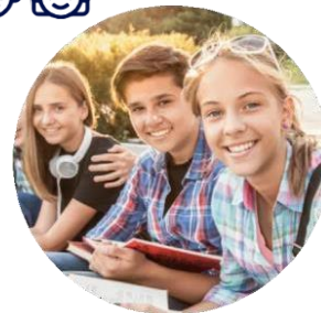
ДЕТСКИЕ ОБЩЕСТВЕННЫЕ ОБЪЕДИНЕНИЯ