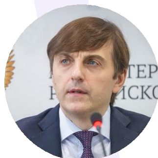
Сергей Кравцов Министр просвещения Российской Федерации